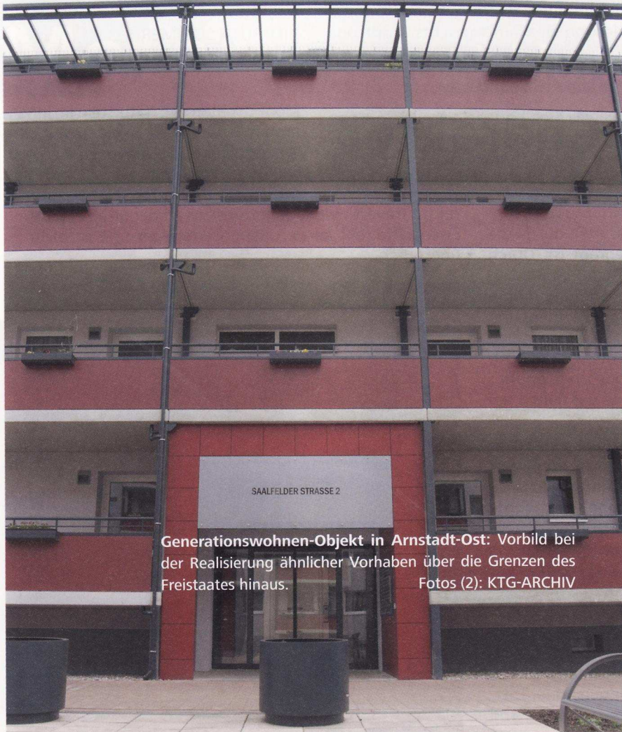
Generationswohnen-Objekt in Arnstadt-Ost: Vorbild bei der Realisierung ähnlicher Vorhaben über die Grenzen des Freistaates hinaus.